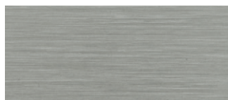
metallo nichelato satinato satin nicked metal