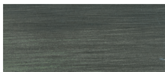
metallo brunito spazzolato a mano hand-finished burnished metal