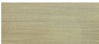
metallo ottonato satinato satin brass-coated metal