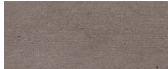
terracotta grigia grey baked clay