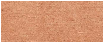
terracotta naturale natural baked clay